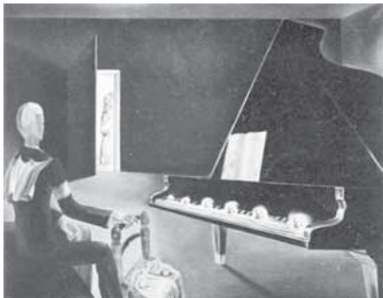
Сальвадор Дали. «Частичное помрачение. Шесть явлений Ленина на ролях». 1931 г.