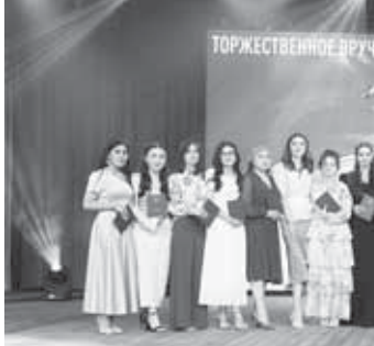
ТОРЖЕСТВЕННОЕ ВРУЧЕНИЕ ДИПЛОМОВ С ОТЛИЧИЕМ

Чествование 576 самых лучших, трудолюбивых, терпеливых и усидчивых выпускников Кабардино-Балкарского государственного университета им. Х. М. Бербекова, окончивших вуз с отличием, прошло в Зелёном театре Нальчика.