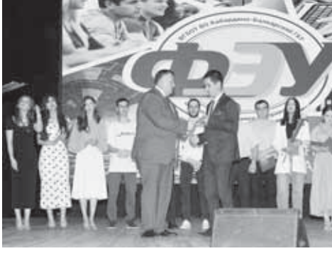
(Окончание. Начало на 1-й с.)

Он заострил внимание выпускников на том, что им необходимо не только сохранить полученные в вузе знания, но и приумножить их, призвал молодёжь продолжить профессиональное обучение: