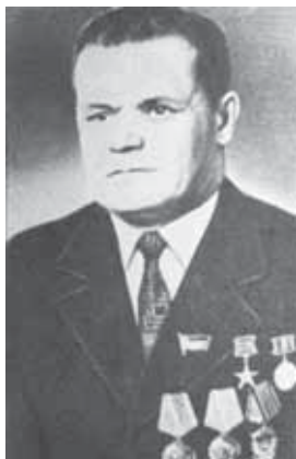
Абубекиров Нажмудин Биалович