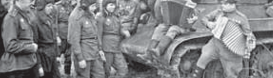
Во время отдыха перед боями на Курской дуге

Битва на Курской дуге В ходе зимнего наступления Красной Армии и последовавшего контрнаступления вермахта на Восточной Украине в центре советско-германского фронта образовался выступ глубиной до 150 и шириной до 200 километров, обращённый в западную сторону – так называемая Курская дуга. Германское командование приняло решение провести здесь крупную наступательную операцию, и в апреле 1943 года была утверждена военная операция под кодовым названием «Цитадель». Предполагалось, что советские войска первыми перейдут в наступление, но было принято решение начать противника мощной обороной, затем перейти в контрнаступление и разгромить его ударные силы. Произошёл