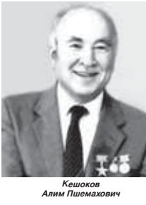
Кешков Алим Пшемехович

(Продолжение. Начало в №№ 96-100 «КБП».) КЕШКОВ Алим Пшемехович – кабардинский советский поэт, прозаик, общественный деятель, народный поэт КБАССР.