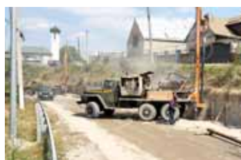
Окончание на 4-й с.

Специалисты подрядной организации разрабатывают грунт для последующего устройства двухслойного основания дорожной одежды на проезжей части и тротуарах, устанавливают бортовые камни. Для обеспечения безопасности дороги обустроят перильным и барьерным ограждением, установят новые автовышки, современные пешеходные переходы со светофорами типа Т.7. Завершить ремонтные работы на объекте и ввести в эксплуатацию планируют в конце этой осени, сообщает пресс-служба Министерства транспорта и дорожного хозяйства КБР.