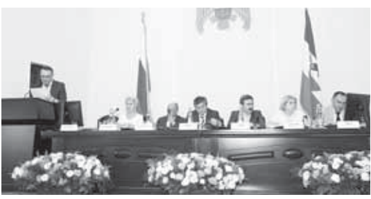
Педагогическое совещание работников системы образования в администрации г. о. Нальчик

Таймураз Ахохов и выразил особую признательность ветеранам педагогического труда. Глава городской администрации пожелал 29 молодым педагогам, которые в этом году начинают профессиональную деятельность в школах и детских садах города.