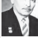
Он родился 16 декабря 1916 года в селении Хулам Терской области. Окончил курсы педагогического техникума в Нальчике, Чабдаров решил кардинально изменить свою судьбу, став военным лётчиком.

Сегодня речь пойдёт об уникальном человеке. Заслуженный лётчик-испытатель СССР Ибрагим Базиевич Чабаев — единственный наш земляк, удостоенный звания лётчика-испытателя 1-го класса.