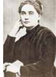
Писательница, переводчица на русский язык романа французского писателя Жюль Верна Мария Александровна Вилинская (Марко Вовчок) (1833–1907)

1993 г. – на базе Нальчикской школы усовершенствований негосударственной формы образования создан факультет Ростовской высшей школы МВД России (ныне Северо-Кавказский институт повышения квалификации (филиал) Краснодарского университета МВД России).