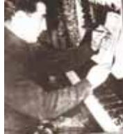
Композитор Мухаддин Фицевич Балов (1923–1984)

3 декабря 1958 г. – Совет Министров СССР принял постановление об организации Нальчикского электротехнического завода.