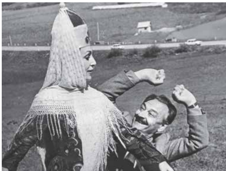
Тося Токова бла Улубаишланы Мутай