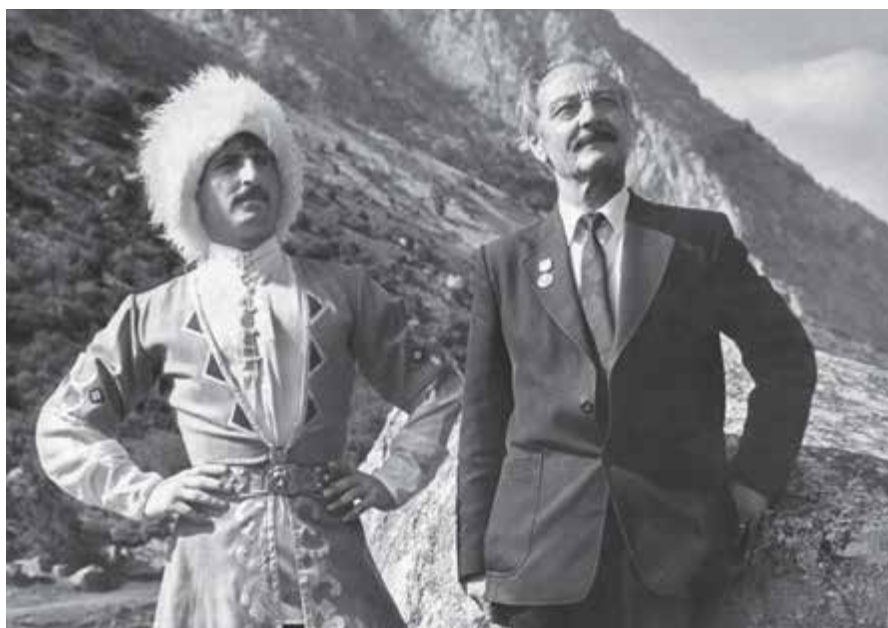
Аптайланы Магомет бла Уллубаиланы Мутай