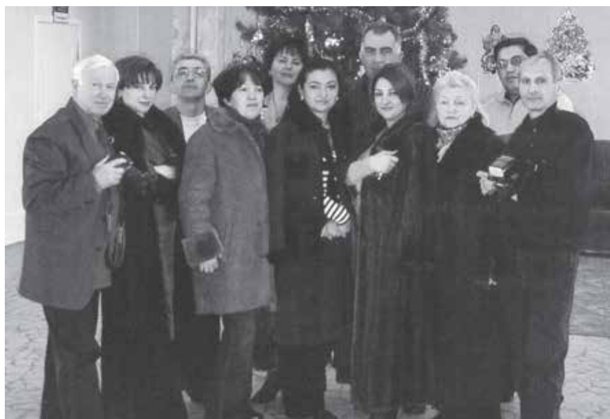
Светлана ишичи нёгерлери бла