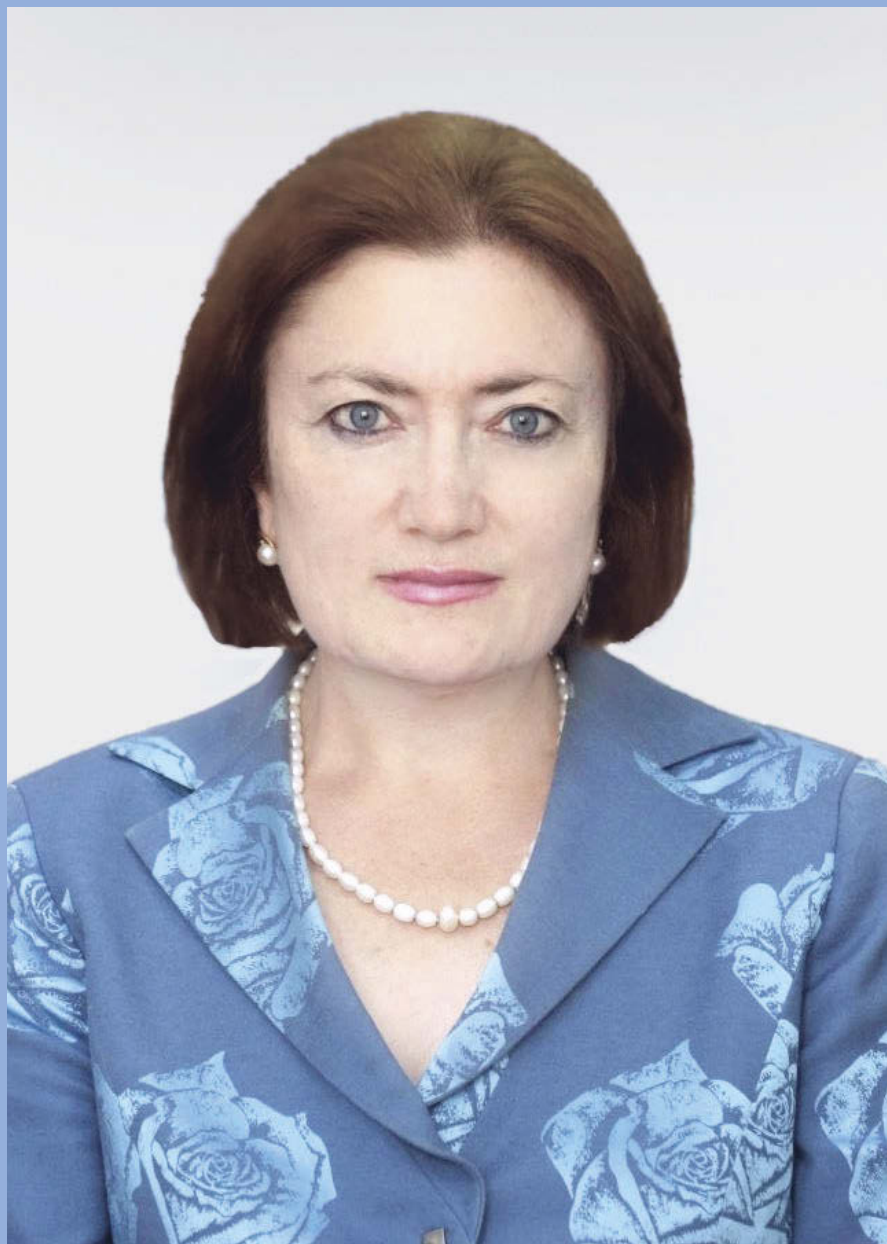
БАШИЙЛАНЫ СВЕЛАНА ФИЛОЛОГИЯ ИЛМУЛАНЫ ДОКТОРУ, ПРОФЕССОР