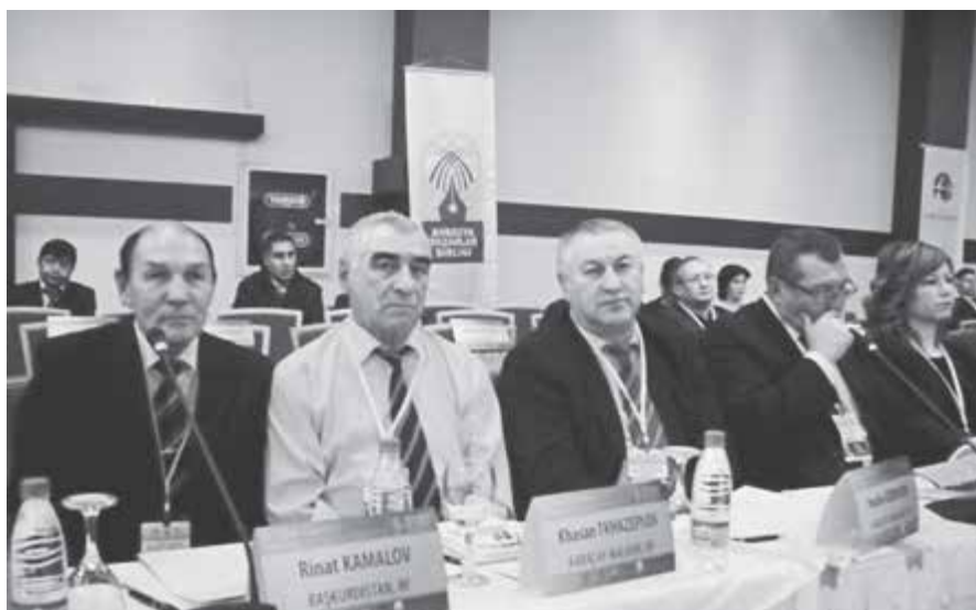
Евразияны суратлау-литература журналларыны конгресси (Анкара)