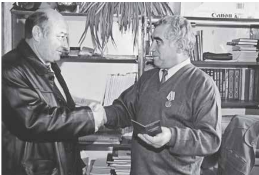
Хасан Тхазепловну Лермонтовну майдалы бла сауғалагъан кезиу

тематика эмда физика тергеуле... «Не этерик эдинг, амал болса кёрюрме», – дегенни айтама да къояма.