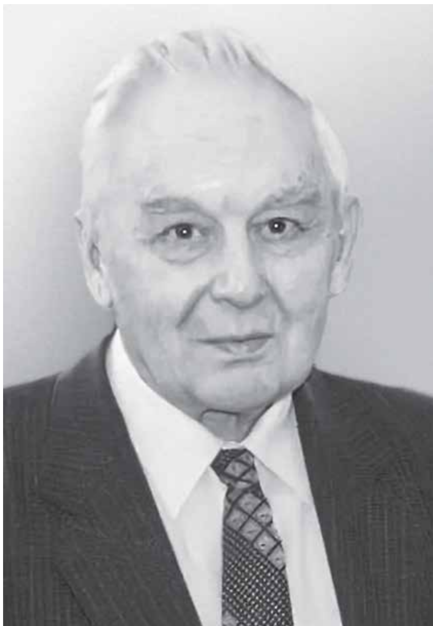
Академик ЭНЕЙЛАНЫ ТИМУР – теоретикалы эм прикладной космонавтиканы мурдорун кбураугъа уллу кыйын салгъан айтхылы россейли механик, физика-математика илмуланы доктору, 1968 жылдан башлап – Россейни Илмула академиясыны член-корреспонденти, 1992 жылдан башлап – академик .