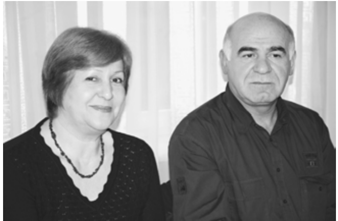
Щэрмэт Людмилэрэ Кьущхьэ Догьэнрэ. 2008

Псом нэхь-рэ нэхь си жагьуэ хьур, сезыудыхыр сытми пщIэрэ уэ, Залинэ?! Уи мыIуэху зумыхуэ цыжаIэм и дежщ. Ар кьызымызмэ – срипсэлъэнукьым, сыщигьэпIейтейкIэ – си Iуэхуш. Псалгэм папщIэ, театрым сыдыхьуэ солбагьу лIы гуэрым театрым уэ-