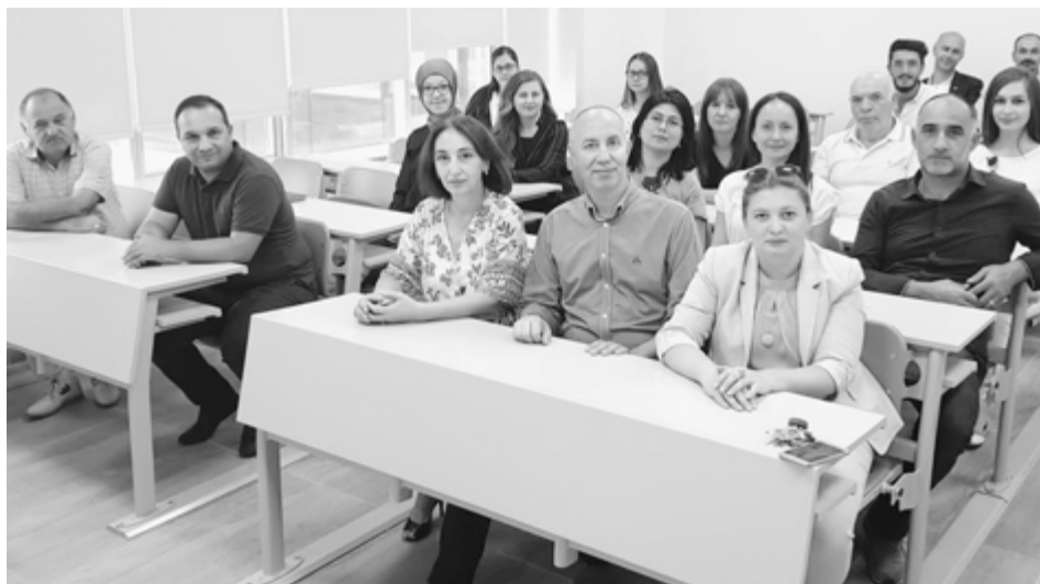
АдыгэбзэмкIэ кафедрэм шылажъэхэмрэ студентхэмрэ.

– ГуфIэгъуэкIэ е гузэвэгъуэкIэ, благагъэкIэ унагъуэ куэдым си-хьащ сэ. Мыбы шыIэ нэхъыжъхэр къуажэхэм къыщыхъуащи, адыгэб-зэр фIыуэ ящIэ, адыгэ гушыIэкIэ дахэ яхэлъщ. Дахашъу зохъурджауэ-хэр. ЕмыкIумрэ екIумрэ зэхашIыкI, сэркIэ ар лъапIэщ. Нэхъыжъымрэ нэхъыщIэмрэ я тIысыпIэхэр ящIэ, унагъуэ хабзэр яIыгъщ. Дауи, абы зэхъуэкIыныгъэ гуэрхэри игъуэтащ. СэркIэ ари тэмэмщ, сыт щхъэкIэ жыпIэмэ, хабзэр и пIэм ижыхъакъым, ар лантIэщ, зэманымрэ узыхэт дунеймрэ епхаш. Пкъыр псэумэ, лъэпкъ зэхэщIыкIыр къэнэнущ.