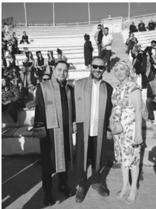
Университетыр кьэзыуххэм я гьусэу.

– Иринэ, уэ ильэс зыбжанэ хьуауэ Тыркум ущопсэу, ущолажьэ. Щалэгьуалэм я закьуэ мыхьуу, абы щыпсэу адыгэхэм нобэ яIэ псэукIэм, гупсысэкIэм утезгьэпсэлъыхьынут. Уэ пщIыху балигьхэм, унагыуэхэм я лъэпкь зэхэщIыкIыр сыт хуэдэ? Бзэр зыщIэр куэд хьууэ пхужыIэну?