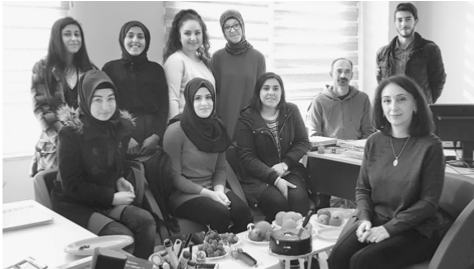
Инчы Иринэрэ иригъаджэхэмрэ.

Ди кафедрэр къыщызэIутхым псом япэу программэр дгъэхьэзыращ. Абы къызэщIеубыдэ еджэныгъэр, тхыгъэр, псэлыэнымрэ едэIуэнымрэ, урысыбзэр, морфологиер, синтаксисыр, мифологиер, адыгэ сабий литературэр, адыгэ литературэр, адыгэбзэмрэ адыгэ щэн-хабзэмрэ, зэдзэкIыныр, нэгъуэщIхэри. Тырку хабзэмкIэ кафедрэм и унафэщIу шытын хуейр къэралым и цIыхуц. Ди кафедрэм и тхьэмадэ Илдырым Ариф тырку щIалэщ, илгъэси 10-кIэ Москва къэрал университетым шылэжыащ, урысыбзэмкIэ щIэныгъэлIщ. Ар бзэмкIэ хуабжыу къыддоIэпыкъу, цIыху хьарзынэщ, щэныфIэщ, гу къабзэщ, гъэсэнгъэ зыбгъэдэлъщ. Сэ Алыхьым фIыщIэшхуэ хузоцI, мыбы сызыщрихьэлIэ цIыхуфIхэм щхьэкIэ.