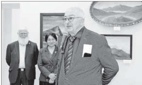
В Музее изобразительных искусств КБР открылась выставка, посвященная Дню возрождения балкарского народа. В ней отчетливо преобладала радость жизни.