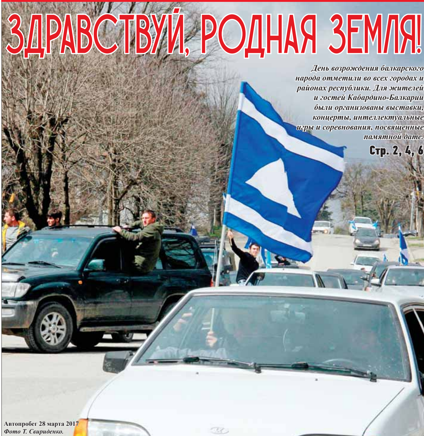
Автопробег 28 марта 2017