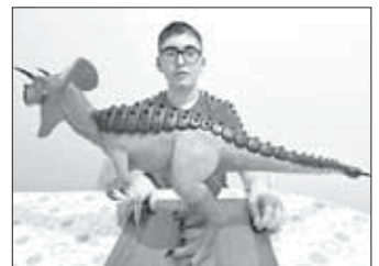
твоих диназавров, родители тебе его, наверное, ведрами покупают?

- На одного – средних размеров – 2-2,5 килограмма примерно.