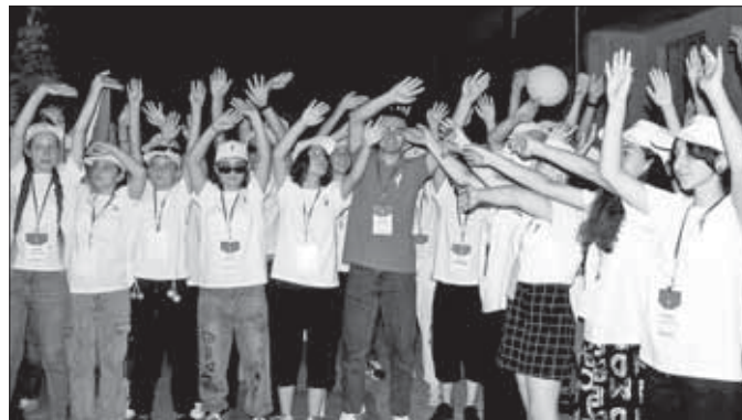
Профильная смена «Время Первых» проходила с 19 по 28 августа в Республиканском детском социально-реабилитационном центре «Радуга» министерства труда и соцзащиты КБР.

края – мы не можем говорить о воспитании ребенка, не погружая его и в патриотическое воспитание, воспитание гражданина своей республики, страны. И если ребенок поймет, что нужно начинать с себя, с элементарных вещей – просто донести фантик до урны – это уже прививает ему чувство ответственности, в том числе за благополучие своей родины».