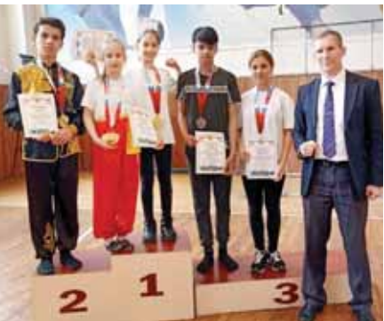
«Аны бла байламлы мектептеле, бийик окуу юйледе, жаш тюрлю аралада да ири кесек жумуш тандырылды. Аладан бири хар баш кюн эртенликке кыурау байракъны кетюоруаю, Россейни сабий эмда жаш тюрлю кымылдауу регион бюлюмоно келечилери кытышандыла.