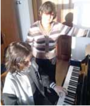
«Аны бла байламлы мектептеле, бийик окуу юйледе, жаш тюрлю аралада да ири кесек жумуш тандырылды. Аладан бири хар баш кюн эртенликке кыурау байракъны кетюоруаю, Россейни сабий эмда жаш тюрлю кымылдауу регион бюлюмоно келечилери кытышандыла.