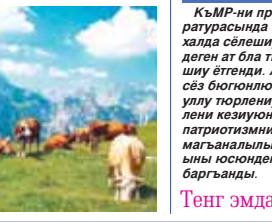
Тенг эмда ачык халда

Белгилисича, кырачай-малкыар халкы ёморледен бери малчылык бла баш тутта келгенди. Ол себептен аны кёншү миллеттеден окуяна иги биледи. Кечгюнчюлукте тошгендеринде да, кызахылыаны, кыргызылыны арасында айырмалы болганылары уа аны шгаптык этеди. Бюгонлюкте мал тутхан кыйынмыды?