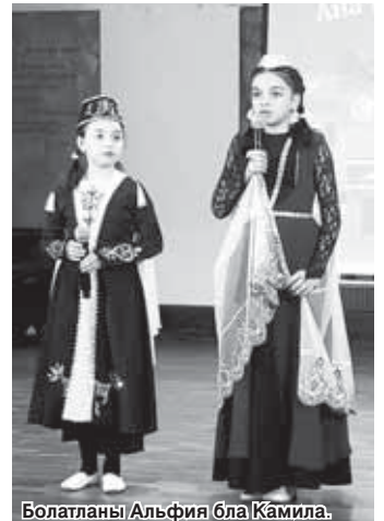
Болатланы Альфия бла Камиланы.

Керти айтадыла, миллетни жаны аны тилиндеди. Ол сездиреди бизге игиликни бла ачыуу, насыпны бла насыпсызлыкны, шухлукъну бла душманлыкны, соймекликни бла коймекликни юслеринден. Хар бир халкыны да тили аны тарыхыны ачыкъ кюзгюсюду, аны ачхычыды, келлик