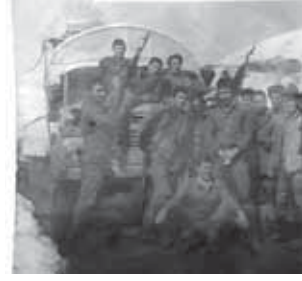
Саманид патчак тукуму, Шендоно заманды НАТО-ну, ызы бла Американы аскерлери...

ны атырып, ызы бла уа кыршуоуга тошгон аскерчилеге ол ачып. Ма былай кыоркуу болу-мада толтургандыла эки баталонну аскерчи-лери борчларын. Эм керти шувукчул, баям, сынауланы кези-уонде тууа болур. «Ол кызауатда биз барыбыз да кыарындышача болуп кыалганбыз. Анда кеп жашларыбыз кыалгандыла, ол жара болгон да ачыкды. Алай жашуу андан ары барды. Афган-дыла биргеми кылуулук этген жашланы кебюсю