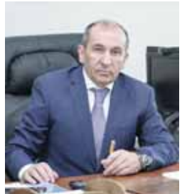
Тегенеклиде сууызга тынгылы ремонт этер план барды.

Ушакъны кезиуеде Къурман Сеитович билдиргенди, «Эльбрус» курорт терк атма-ла бла айныды. Кышы кезиге Азая таллада 800 машина сыйынарча жер къураылганды. 2022-2025 жылгъа федерал бюджетден курортну айнартуугъа бѐллонген ахчаны ѳлчми 16 миллиард сом чаклы бирде. 2030 жылгъа уа Азуда тау лыжа изланы 47 километрге, 14 канат жол хазырланлыкды эмда къонакыла 4200 чаклы бир жер къураылганды.