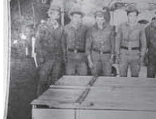
Кези-уонде ол кыалны кызауатда болгын, ёлмюно кезоне кыар-аларына кыауу, кесери алларына жашуу-кыаум болуп, шов туруучудула.

Болсада Ырыскы бла жалчыту энци баталонну борчларын юс-манга афганлы урушун ветеранарына благын да ушак этерге тошгенди. Аланы арасында кызауатны юсюндө ачык халар айтырга, сакгычырга оймегене бек азыла. Ма Даниялга да оруна берип, кылуулук этген кези-уде кыюну юсюндө айтырын не бек илгерге эсем да: «Аны эсиме тошюрюге оймемей», — деп жуура-плаганды. Болсада Ырыскы бла жалчыту энци баталонну борчларын юс-