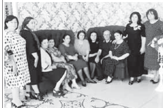
Быйлыны Устазны бла насихатчыны жылна санануу юсюнден кызырал башчыбызны онуюн бек маганалыгына санаганам.

Быйлыны Устазны бла насихатчыны жылна санануу юсюнден кызырал башчыбызны онуюн бек маганалыгына санаганам. Кертти окуу, усталык жупулы эмда кыйын ишледен бириди. Юйорде окууга ата-анага хар сабийине керекли сезле, тийишли