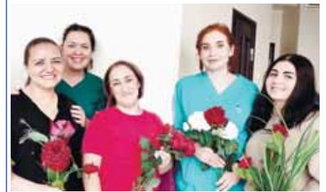
Тиширыулары халкъла аралы кюнюне жораланган материалланы 9,10, 11-чи бетледе окъугузу.

Къабарты-Малкъарны битеу тиширыуларын алгъышлай, саулукъ, насып, ырахатлыкъ тежейм. Бар игиликле да сизни болсунла!