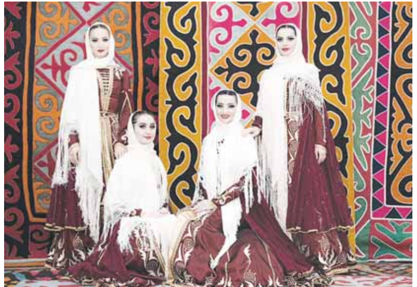
«Балкария» фольклор-этнография къырал тепсеу ансамбльни солисткалары.

Булбул жырлаудан. Ётгюрлюкню алганма мен Ётгюр тау суудан. Ёттемликни алганма мен Бийик тауладан. Жюрегими тазалыгъын – Тау шауданладан. Ышарыу алганма мен Эрттен жулдуздан, Намысны да бийиклигин – Беш тау аууздан.