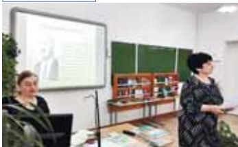
Къонакыла китапладан, жюнден, алтын халыпадан зтилген ишледен, спортда болдурулган жетишимлери ючюн алгъан сауыгъарындан кыралганды.