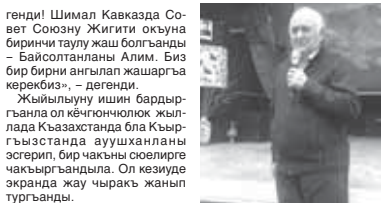
Жазим бля Викторина малкквар халккы, ол сюрючю жолуна чыгарганын ачы тангыдан башлап, берн кыайтхыны кыаллай жашаганын, кыаллай сынауладан ётгенин кыксыа билдирюуле бля айтып баргандыла. Ол хапарга берн музыка композицияда кёчючюлукте аталган жырла, назмула айтылгандыла.