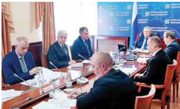
законнагу бузуклык этилгени округну битеу регионларында да эсленгени, ала бла байламлы тийишли мадарла да этилгенин чертгенди. Бириккен тизмеде аллай 46 къурулуш объект барды. Оп а битеу да 380 минг квадрат метрден артыкъды. 2022 жылны эсеплерине кереланы саны СКФО-да 28 процентте (18 объектте) азайганды. Болсада Дагьстанда, Ингушетияда, Шимал Осетияда бла Ставрополъ

Ушакны кезуюнде СКФО-ну регионларында юйле ишлеуге аха ююшлерин къошхананы законлу сейирлерин эмда праволарын жалчытыу не халда болганына кыаралганды, баша сорула да сюзюлгенди. Юрий Чайка адамла ахчаларын къошуп бардырылган къурулуша