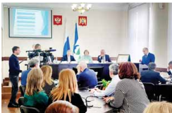
толтуругъа эс бурунганды. Былтыр геополитика эмда экономика болумланы осалдыгын, эпидемиология жаны бла салынган хаталаны кетериге кереклисин да эсге алып айтса, ол бютонда магъаналы эди дегре боллукъу. Министерство кыарал финансланы журютюу жаны бла кыйыматлы кыармашханды, анга керелю алыч юч регионну