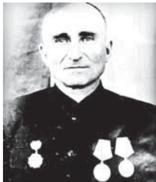
клери ючюн Ата журт урушун экинчи даражалы орденине тийишли кёрюлгенди. Жуков атлы, "Японияны хорлагъаны ючюн", "Ата журт урушун ветераны",