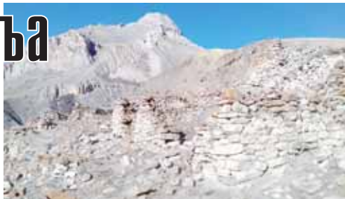
Ачы элли эски журтлары.

Аланы бир къауумуну юсюнден айттайыкъ. Къамгъут бийни кешенесинден башлайыкъ. Тырнауаудан эки-юч къычырым Элбрус таба барып, жолну сол жанында, дуппур башында,