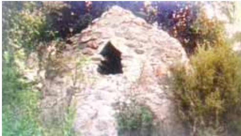
Къамгъут бийни кешенеси.

Малкъар жанында Мукуш, Къоспарты элдеде ташла башхаракъдыла. Ала кюмюш бетли жылтырайдыла. Къаты ташладыла, ишлерге къыйындыла. Бир юйге уа къаллай бир таш керек болады. Айхай, ала да къатынгда болсала. Узакълардан ташыргъа тѳшеди. Юйге уа агъач да керек болады. Аны уа къауум къычырым элден кенгден ѳгюзле бла тартдырып келтиргендиле.