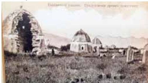
Кѳнделен элли бурунгу кешенелери.

Андан сора уа къалала, кешенеле ишленгендиле. Ала уа кеси заманларында атлары айтылган адамлагъа аталыпдыла. Бир-бирлерини хапарлары бююнлюкге жетгендиле. Кѳчгюнчюлюкю кезиуонде уа ол элле оюлдула, чачылдыла. Алагъа шѳндю къарасанг, бир уллу уруш юслери бла ѳтген сунарса. Энди аланы жангыртыр онг жокъду.