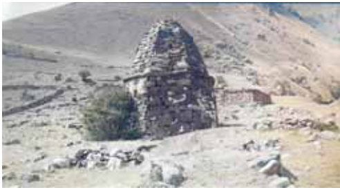
Къоспарты элли кешенеси.

тѳп-тѳгерегин чырпы басып, акъ кешене турады. Хапаргъа кѳре, ол онжетинчи ѳмюрню ал жылларында ишленгенди.