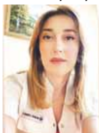
бютон бек кьыйнады. Жашым, амалсыз болгьаным кьорюп, терк болушук берген службачы сьелешедим. Алай, враччы сакьлап турмай, мени машинасына ол-

Сьезюс, бизни хар бирибизге да саулуугубуздан багылы зат жокьду. Ол осал бола башлагьанлай а, олсагьат врачдан болушук излейбиз, анга ышанабыз. Уста, билимли, адамлыгызуу болгьан врачча тубесег а, анга ырызлыкьызыны билдирбедиз, атын огурлулук бла сагынабыз. Хау, ол алайды. Анга шагьатха жалаңда бир юлгю келтирейим.