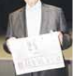
СОЗАЙЛАНЫ Ахмат, КъМР-ни халкъ поэти.

гылатырга керекди ана тилибизде чыкъган газетини, журналланы да миллетибизге къаллай улуу магынаны тутханлары. Кѣчпюнчлолукде халкъыбыз аланы къаллай бек кюсегенлерини да олголе келтири. «Заман» ана тилибизини сакъланган, халкъыбызны магынасын, даражасын кѣтюрген кючдю.