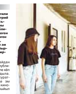
«Жерле» проект UK социал сеть

Уста да ёхтемленди окуучулары бла. Аладан бири - Хайрыланы Алим-врач-онкологду, аспирантураны жетишмели бошоп, бусаргата Москвада болмачыны бёмююн башчылык эдиле. «Ол шкода окутуучу болмагъа эди, кёп затны билгире талынган жаш эди. Окуудуа, ишде да жетишмели болганына бек кыуанам. Окуучуларымы араларында мен ёхтемленирчалары дагында кёпдөмө».