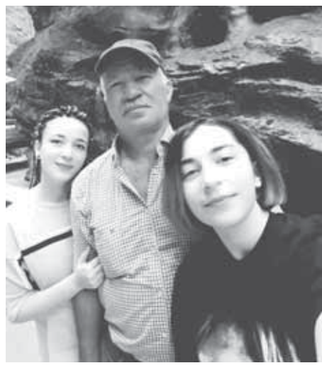
– Эсимдеди, сен африкалы эзмеле этип, чачынгы да бир сейир боучунг...

– Жаш адамлагы бек магьаналыды. Биз, жаш адамла, юйюрноюно да снобиз, алай окуй-окъуй кетип, артада иги ише тохтамаган – ол тышюнюдю? Хар бирибиз да айнуугьа кьошумчулукь этерге керекбиз. Кылубуздан келгенча. Аны бла бирге багы-алы, сөйгөн адамларыбыз бла байламлыгыбызны кюнледери. Мен анамы, атымы, эгечими, Яникойда юйюмю бир минутха окъуна унутмайма.