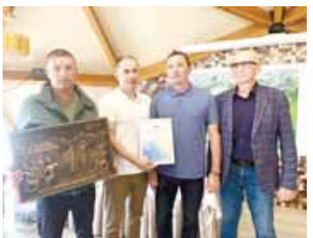
Ол жылы узуну ишлерки. Аны ючюн бир-бир отуулада кыш суукунда жанынчыра маздар этилгенди. Ол сөбөндөн, парадом ишлемесе да, мында турурга сөйгөлөгө алай онт тапдырылыктыбыз.