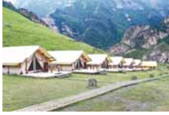
Къабарты-Малкъарда биринчиле болуп «Флай Чегем» парадомун мурдорунда аламат глэмминг-парк