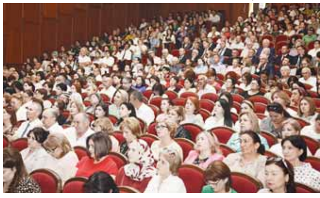
Ахыры 2-чи бетдеди.

Сайлауларына кертичлей кыала, ёсеп келгенлини боюнго илмерини тийишлиликде окутуунагыа эмда койретилгенге ырызлыгыны билдирип, жаңы жетишимге, сорулук-эсенлик тежегенди. Бусагытада билим бериуде бла койретилгенге болганын тюрлениуле Россой окутуу жаны бла дунияда эм ахшы он кыралны тизмесине тошур ючюн илгерилерине эсерте, ол мурагда да жетергибизге ийналдырганды.