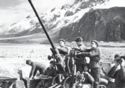
12-чи аскерни комендирующий генерал-майор Гречкону өзлериини топуралдыла курсантла.

Шимал-Кавказ фронтну комендирилерге хазырлаганы аскер училищени 1940 жылда Волгоград областыны Уропинск шахарында ачылганды, алай 1941 жылы сентябринде аны Кыбарты-Малкарны ара шахарына көчүрөгө оноу этилди. Анда комендирилер кыскартылган программага көрө хазырлап, эки жылы уропун алып айга, фронтка, гитлерчилени жоке этерге ашыргандыла.