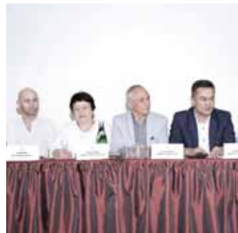
Башкортостаны ичинде жашауучу актёрлорун кесирини усталыкларын кыралны кыалайдына да көргөзтөр он тапханды.