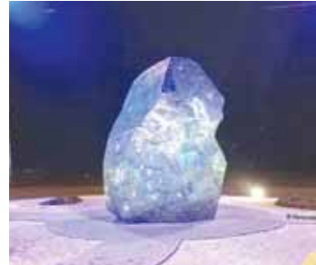
Алгышылалдан сора Конгресс ишин башлаганды.