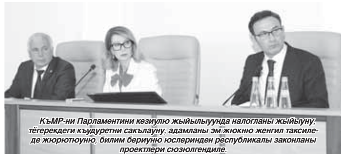
КъМР-ни Парламентини кезиуу жыйылыуунда налогланы жыйылуу, тѳгерекдеги къудуретни сакълау, адамланы эм жюкно женгил таксиледе жюрютюуно, билим беруино юслеринден республикалы законланы проектлери сюзюлгендиле.

- Федерал излемлеге кѳре, коммерциялы болмаган организацияны иелигинде жашу журтланы, гаражланы, машинаны салырча жерлени кадастр багъалары 300 миллион сомдан озгъан кезиуде, налог РФ-ни субъектини закону бла тохташдырылады эмда 0,3 процентден озмазгъа керекди. Бу жорукъ республикалы законлагъа кийириледи. Эки закон да тынгылы сюзюлгендиле, битеу эсгертиуле эсге алыннгандыла, - деп анылатханды ол.