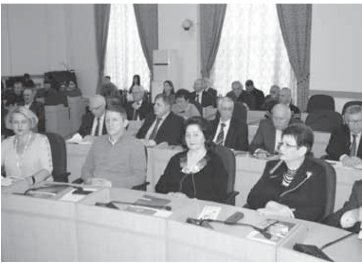
ген болушукъ сакъланган ахшы эсеплеге келтирмейди. Палатада оюм этгенлерича, халны тюзетир ючюн, кыралны Конституциясыны юйюрге, аналлыкъга, аталыкъга эм сабийликке, юйор кыруулауула, сабийлени ѳсдюрюуге себеплик этген бегимлерин жашауда тийишлисича тынгылы бардырыгъа керекди.