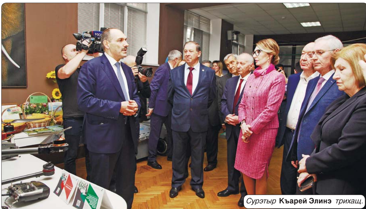
Сурэтыр Къарей Элинэ триащ.

центрым гуманитар къэхутэныгъэхэмкІэ и институтым къыщыдэкІа тхылгъхэри хэтэщ выстэкэм.