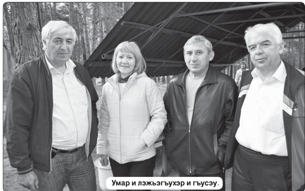
Умар и лэжыгъуэр и гъуэгуэ.