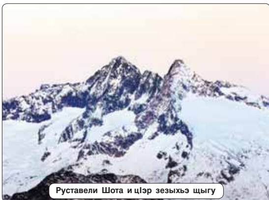
Руставели Шота и цлэр зезыхьэ шчыгь

Катын-Тау бгым метр 4979-рэ и лъагагьыц. А шчыгум япэ дыдэу цыху шчыдэкар 1889 гьэрц. Абы лъандэрэ ар зэи цыхуншэ хуаакьым. Бгым узарьдэки лъагэу зыбжанэ илэц, и гугъагькнэ зэхуэмьдэу. Катын-Тау ильэс псом узэ тельц. Къруршым и сыт хуэдэ лъэныкъуэмкнэ удэкину гугъу ещ мывэ къельэлэхэм, усукхуэ шцлэх-шцлэхурэ къехым, дунейм и шчытыкнэм палъэ кнэщкнэрэ зэрызыхуэжым. Хуабэ дыдэу шчытурэ, жьапшэ шхьэу къыкыуэуэуэ усукхуэ къышхэи къохуэ. Гъэмахуэм къруршым и цыгум шчылэр гра-