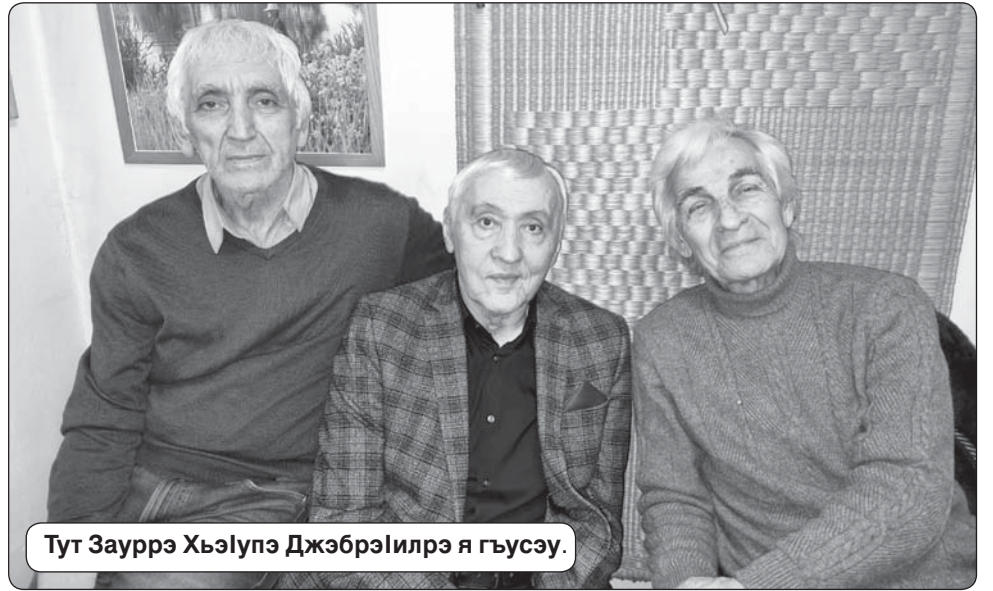
Тут Зауррэ Хьэлупэ Джэбрэилрэ я гъусэу.