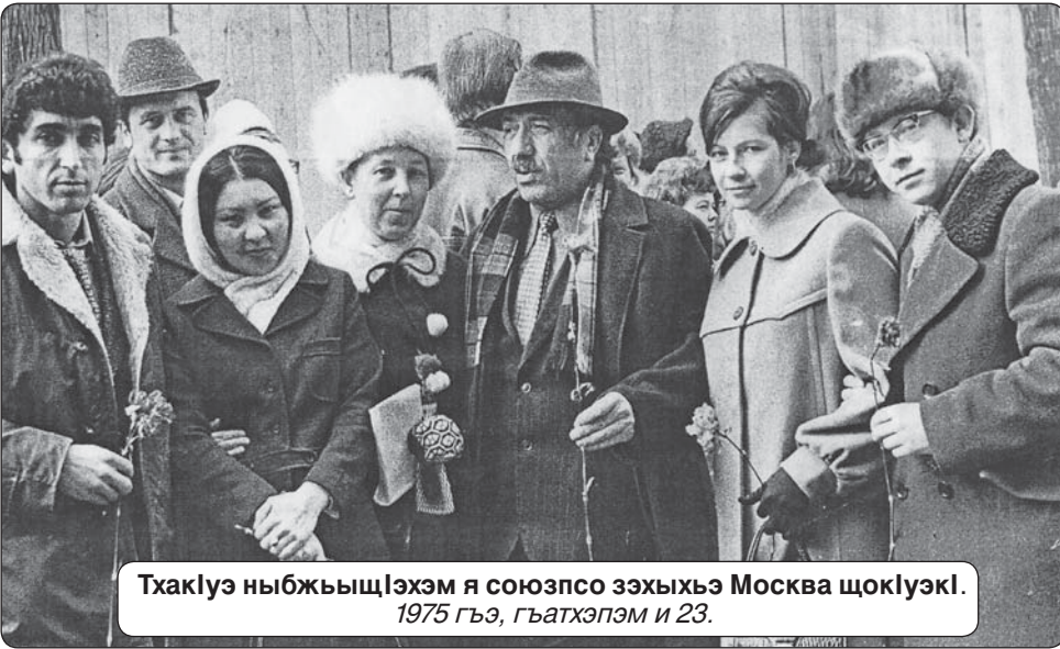
Тхаклуэ ныбжьыщлэхэм я союзпсо зэхыхэ Москва щоклуэкл. 1975 гъэ, гъатхэлэм и 23.