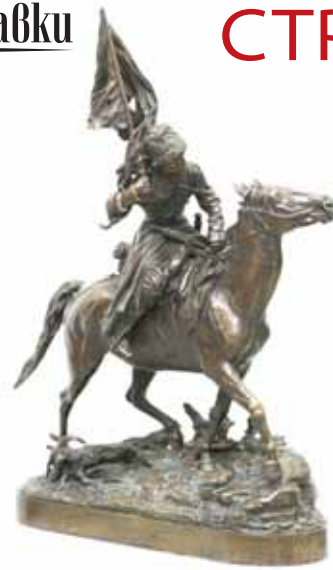
Е. Лансере. «Казак на коне со знаменем». 1870-е гг.