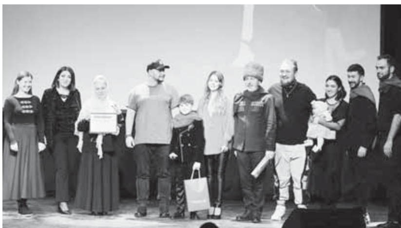
19 января на международной выставке-форуме «Россия» в рамках всероссийского форума «Родные – любимые» в Москве состоялось официальное открытие Года семьи. В рамках этого мероприятия был проведен масштабный конкурс «Династии России».