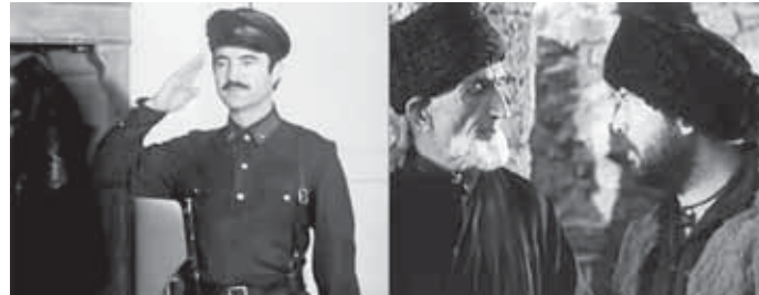
45 лет назад, в 1979 году, на советские экраны впервые вышел фильм «По следам Карабаира», главный герой которого – Жунид Шукаев распутывал загадочное преступление – похищение породистого скакуна. Спустя год, в 1980-м, на той же студии «Владикавказтелефильм» была снята кинолента «Кольцо старого шейха» с теми же главными героями, но уже о новом преступлении.