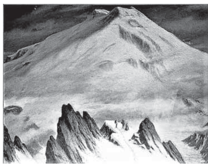
М. Ваннах. Эльбрус при восходе солнца, 1978 г.

Полотна М. Ваннаха проникнуты любовью и благоговением перед природой Кавказа. Особенно обострён он воспринимал знаковые, уникальные по своим географическим и природным характеристикам места. И в этом можно увидеть культ гор, ярко выраженное поклонение художника горам. Большинство пейзажей Ваннаха выполнено на живописно-пейзажистических принципах с глубоким пониманием особенностей изображаемого пространства, световоздушной среды, времени года и суток, погодных условий. Художник прекрасно владел секретами мастерства, позволявшими ему через природные виды транслировать своё настроение и переживания.