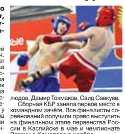
Сборная КБР заняла первое место в командном зачёте. Все финалисты соревнований получили право выступить на финальном этапе первенства России в Кастельоне в мае и чемпионате России в Кемерово в ноябре.

В спорткомплексе «Гладиатор» прошли чемпионат и первенство СКФО по кикбоксингу по трём дисциплинам: лэйк-контакт, поинтфайтинг, собравшие 560 участников из семи субъектов округа. В течение трёх дней выявляли сильнейших в поединках, прошедших как на ринге, так и на татами.