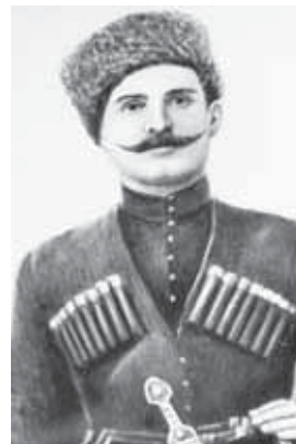
Участник Гражданской войны Хаджимурза Акаев (1874–1933)

Шуйский – преподаватель химии и физики Ленинского учебного городка, первый метеоролог Кабардино-Балкарии.