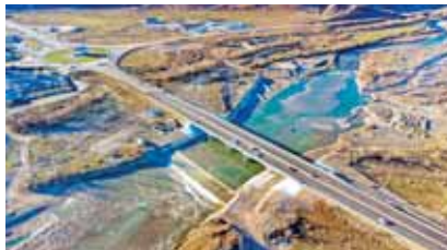
Подготовила Вероника ВАСИНА

трассы «Кавказ». Также капитально отремонтируют мост через оросительный канал рядом со станциях Шелковской на 61-м км подъездной дороги к Грозному. К этому сроку будет завершён и капитальный ремонт моста через оросительный канал под Бабаюртом в Дагестане на 352-м км автодороги Р-215. Сооружения пере-