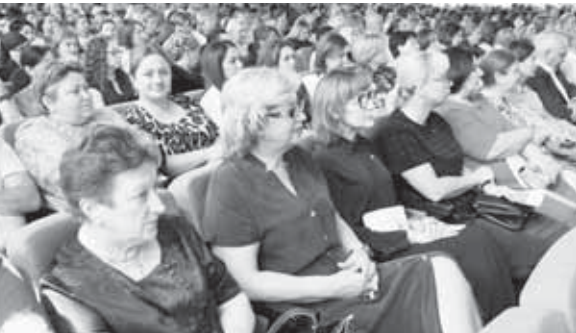
(Окончание. Начало на 1-й с.)