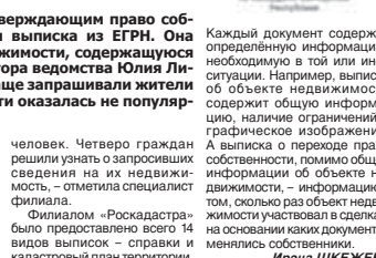
Каждый документ содержит определённую информацию, необходимую в той или иной ситуации. Например, выписка об объекте недвижимости содержит общую информацию, наличие ограничений и графическое изображение. А выписка о переходе права собственности, помимо общей информации об объекте недвижимости, – информация о том, сколько раз объект недвижимости участвовал в сделках, на основании каких документов менялись собственники.

Не менее структура бизнеса, самостоятельные участники дробления бизнеса могут перейти на общую систему налогообложения либо перевести деятельность на одну из компаний группы. Изменение организационной структуры бизнеса может по-