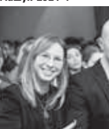
Участники форума «Старт Мауш-2024».

Общероссийское общественно-государственное движение детей и молодежи «Движение Первых» – крупнейшее в стране сообщество детей, подростков и взрослых объединяющих государственные и общественные институты для формирования единой воспитательной среды. Инициаторами мероприятия выступили региональное отделение «Движения Первых» Ставропольского края, Министерство молодежной политики Ставропольского края, центр знаний «Мауш», аппарат полномочного представителя Президента Российской Федерации в Северо-Кавказском федеральном округе.