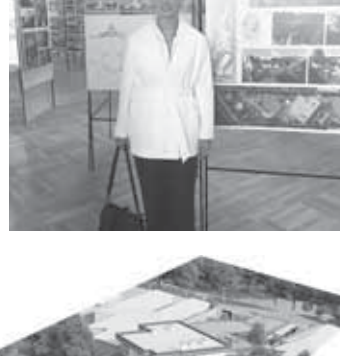
Архитектурный проект «Дом-яхта».

Блок жилых помещений – двухэтажный дом – делит участок на парадный гостевой двор и приватную зону отдыха семьи. Третий блок – бассейн – разделяет приватную зону на официальную и пляжную. Выразительное остекление бассейна визуально объединяет эти зоны, расширяя и увеличивая зрительно небольшие площади. Плоские кровли, расположенные каскадом, повторяют рельефное понижение уровня земли к ручью, протекающему в глубине участка. Они выглядят «злыми монстрами», покрытым из растительного слоя. Это создаёт эффект зрительного увеличения пространства двора при обзоре