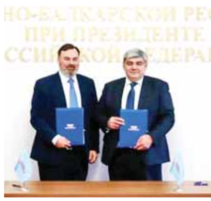
По материалам пресс-службы Главы и Правительства КБР

Кабардино-Балкарской Республикой и президентской платформой «Россия – страна возможностей», а также подписание «дорожной карты» по его реализации. Документ расширяет возможности в области поддержки талантливой молодежи, формирования кадрового потенциала региона в различных отраслях. «Уверен, что подписанное соглашение позволит развить уже достигнутые результаты. Планируем создание сообщества выпускников проектов платформы «Россия – страна возможностей», активное участие в новых конкурсах и совместные проекты. Это будет способствовать достижению одной из ключевых национальных целей, поставленных нашим Президентом Владимиром Владимировичем Путиным – реализации потенциала каждого человека, развитие его талантов, воспитание патриотичной и социально ответственной личности», – написал по итогам встречи в своём телеграм-канале Казбек Коков.