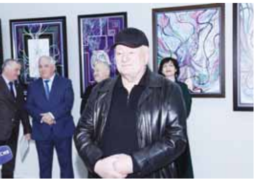
Выставка работ Руслана Каноква

В Национальном музее КБР состоялось открытие персональной выставки работ народного художника КБР, почётного академика РАХ Руслана Каноква «Творю от сердца и души», которая приурочена к 75-летию юбилею автора.