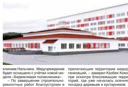
По материалам пресс-службы Главы и Правительства КБР

на улице Шогенова, к которой прикреплены 7 фельдшерских пунктов, центра микрорайона «Восточный». Эта цифра будет расти, и потенциал у учреждения имеется – оно рассчитано на 500 посещений в сутки. Капитальный ремонт, который сейчас здесь ведётся по программе модернизации первичного звена здравоохранения, позволит оптимизировать условия оказания медицинской помощи, как это сделано в первой детской поли-