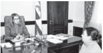
Что касается этого приёма, вопросов немало, несмотря на то, что сегодня в республике очень много делится...