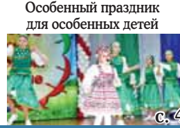
Особенный праздник для особенных детей