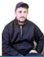
Получив повестку, он не колебался