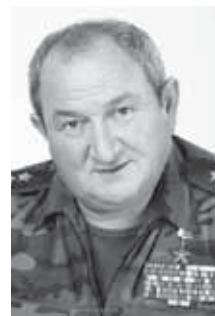
Трошев Геннадий Николаевич генерал-полковник 1947-2008